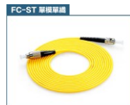
FC 轉 ST