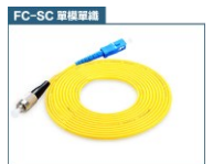
FC 轉 SC