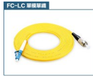
FC 轉 LC