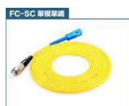
FC 轉 SC