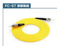
FC 轉 ST