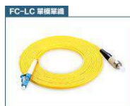
FC 轉 LC