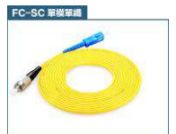
FC 轉 SC