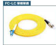
FC 轉 LC