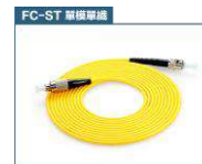
FC 轉 ST